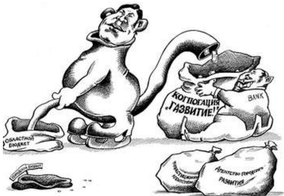
Бездонный кувшин РосПила