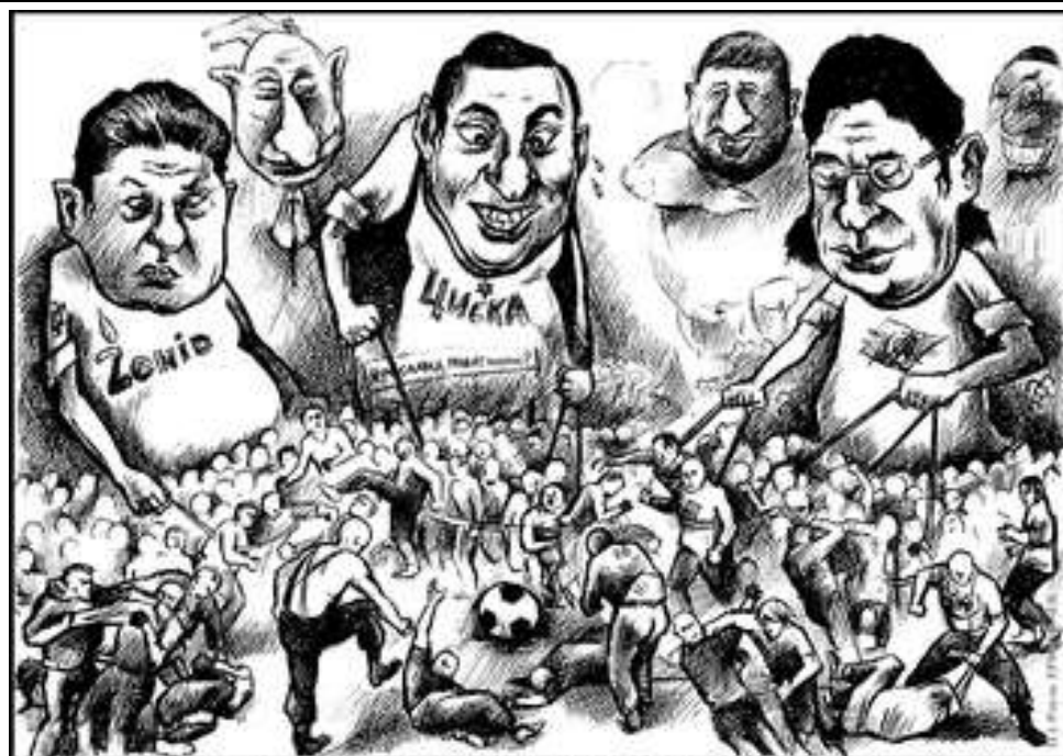
ОСОБЕННОСТИ НАЦИОНАЛЬНОГО ФАНАТИЗМА