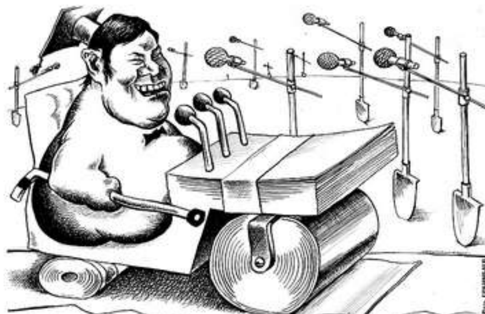
МАГИСТР ДЕЛОВОГО АДМИНИСТРИРОВАНИЯ...